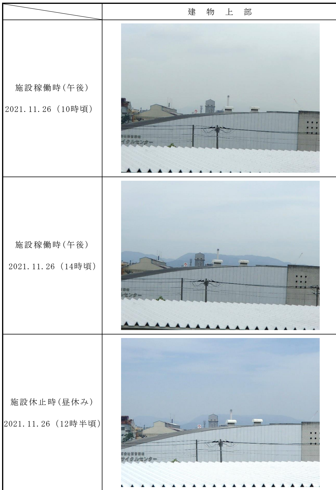
図-2 粉じん発生状況